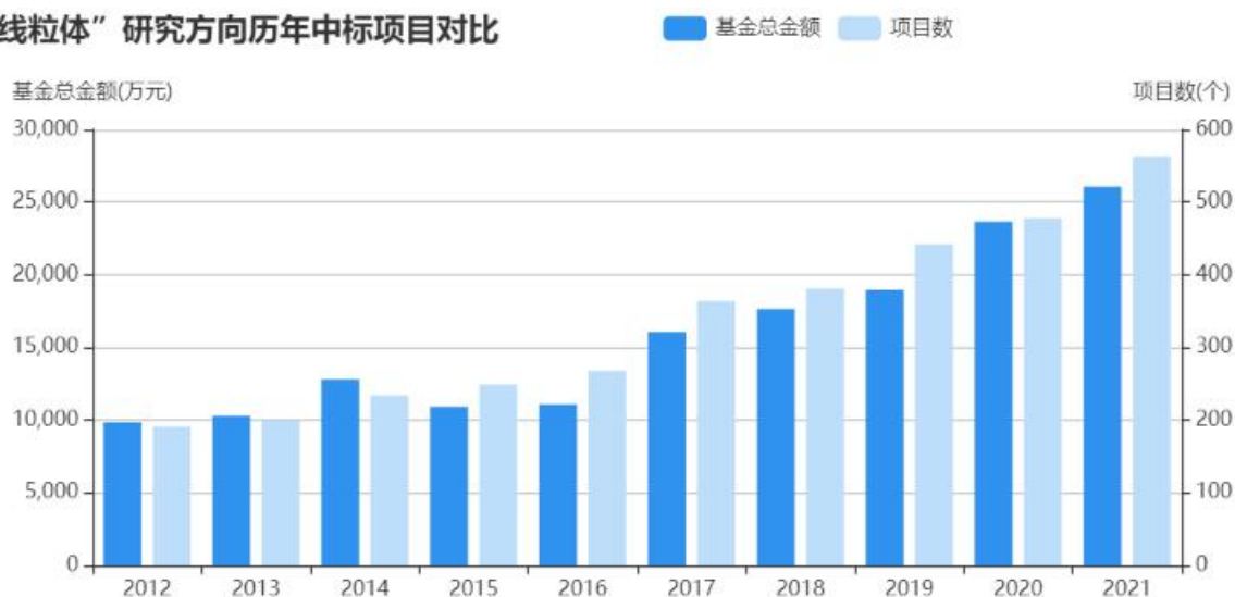
“线粒体”研究方向历年中标项目对比

最重要的是，线粒体还可以通过多种机制控制细胞死亡的方式，特别是调节性细胞死亡（RCD），如细胞凋亡（apoptosis）、NETosis、细胞焦亡（pyroptosis）、坏死性凋亡（necroptosis）等。